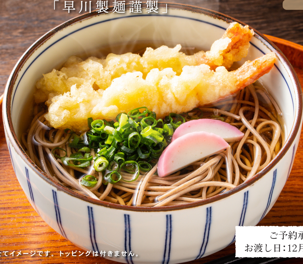
写真は全てイメージです。トッピングは付きません。

ご予約承り締切:12月27日(水) お渡し日:12月29日(金)・30日(土)・31日(日)